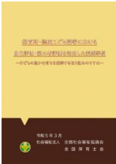
保育所・認定こども園等における 自己評価・第三者評価を利用した実践事例